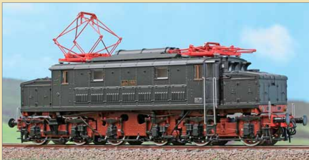
Locomotiva elettrica E626.101 in livrea nera, con emblema storico da applicare, Deposito di Foggia. Electric locomotive E626.101 in black livery, with historical emblem to apply, Foggia Depot. Elektrolokomotive E626.101 in schwarzer Lackierung, mit historischem Emblem, Bw Foggia.