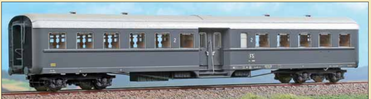
Carrozza FS Tipo 1957R (Corbellini lunga o Corbellona) in livrea grigio ardesia con marcatura unificata e carrelli FS 27. FS car Type 1957R in slate gray livery for local service. FS-Wagen Typ 1957R (langer Corbellini) in schiefergrauer-Lackierung.